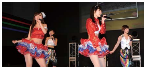
JKカップの0.01秒差逆転優勝のシーンも大型スクリーンで紹介

来年で芸能生活30周年ということで、今年はぜひ映画のプロジェクトを立ち上げたいね。クルマ系の映画だったらいいよね。